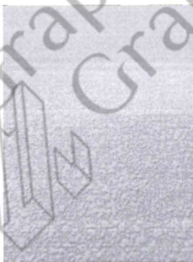
Рисунок 1 – Фото поверхности образца конструкции

1.2 Замена объектов исследования при проведении испытаний в соответствии с техническим заданием не предусмотрена.